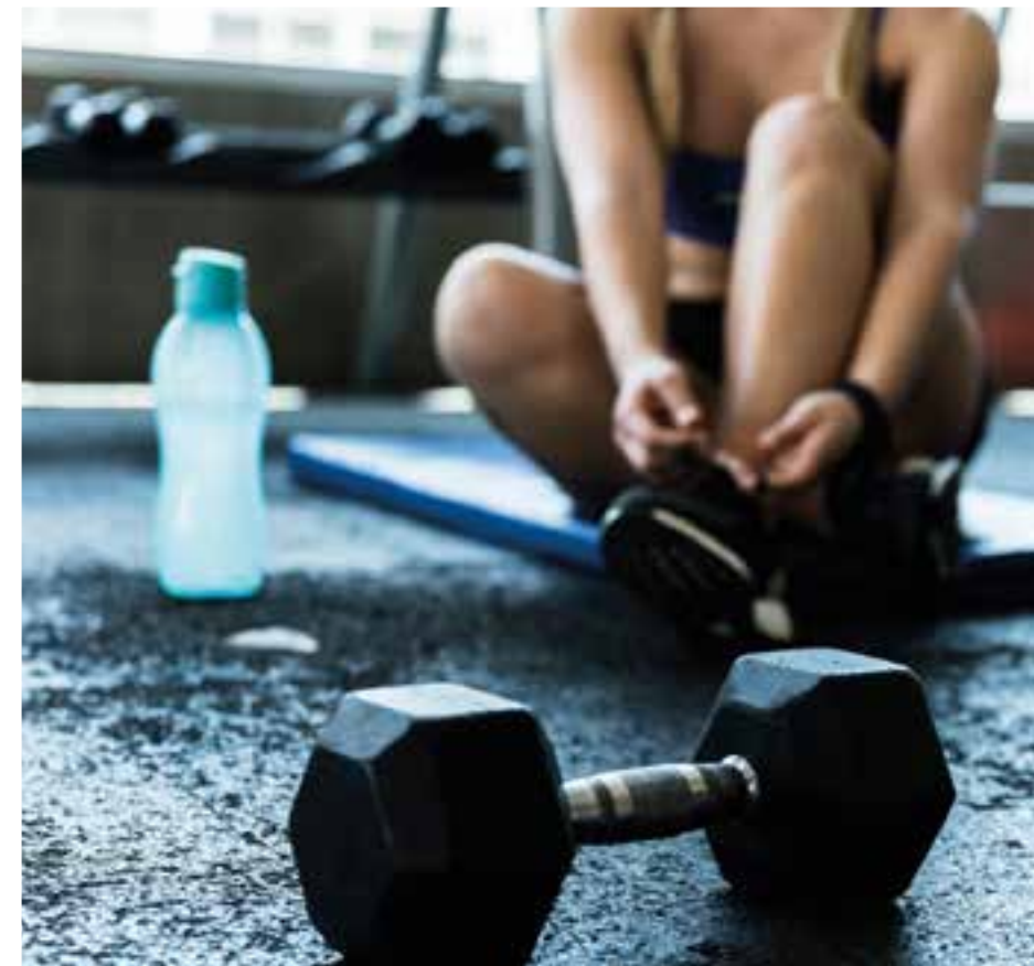
Más de 60 m2 para disfrutar de una vida saludable y activa.