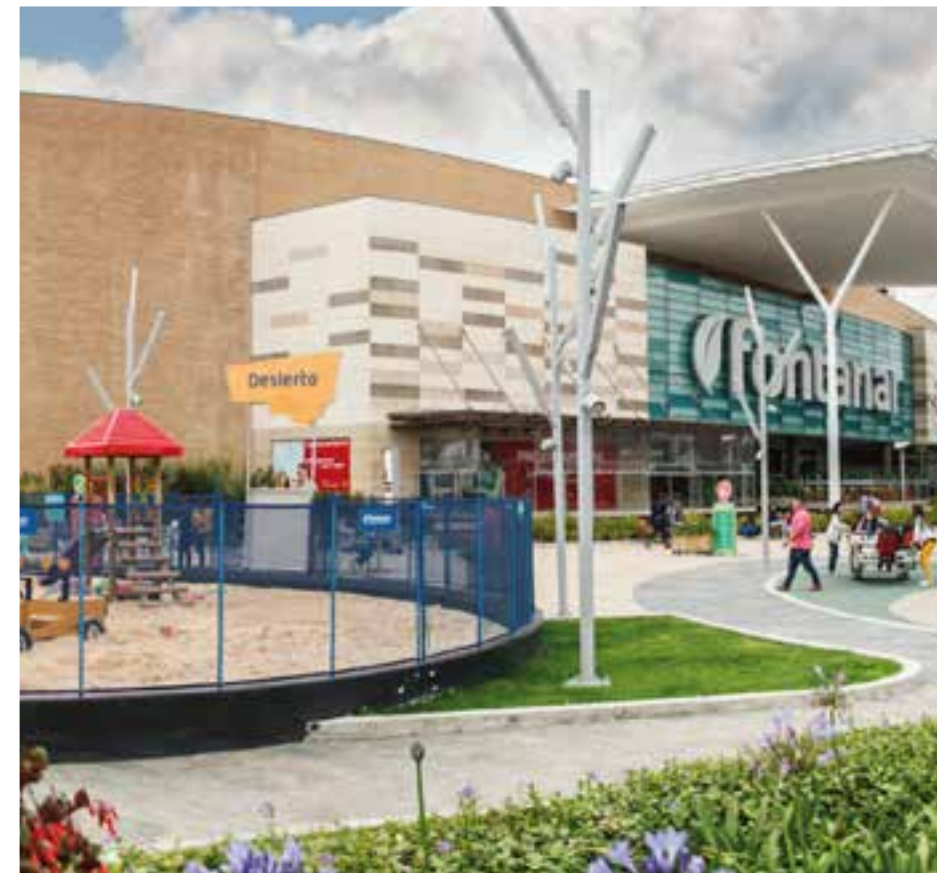
Zonas diseñadas para ofrecer una mezcla comercial, de moda, de gastronomía y el mejor entretenimiento para jóvenes, niños y adultos.