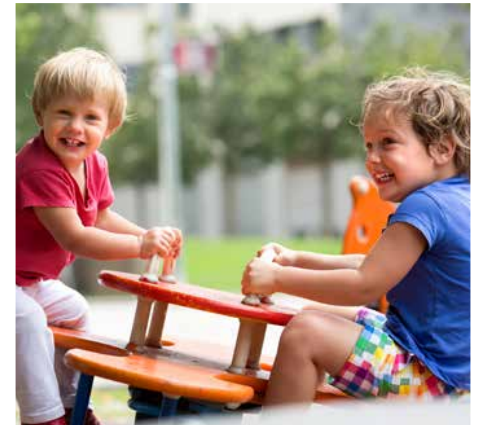
Colecciona en familia y amigos momentos llenos de alegría y recreación.