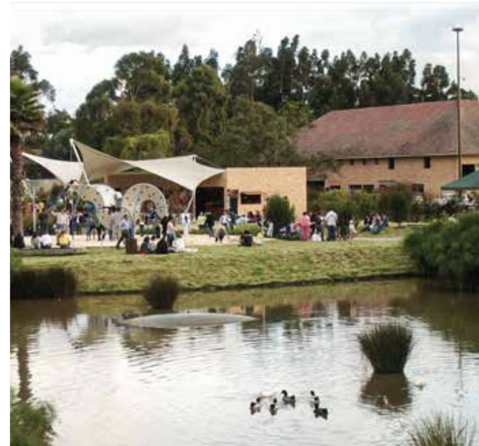
Más de 25.000 mts2 de parques recreacionales y zonas verdes para disfrutar en familia y amigos.