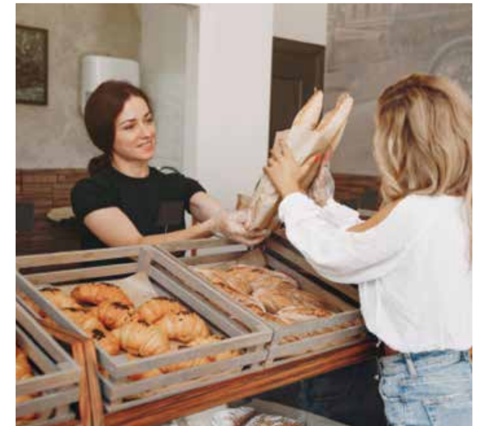
Lugares especializados en productos elaborados artesanalmente, frescos y deliciosos.