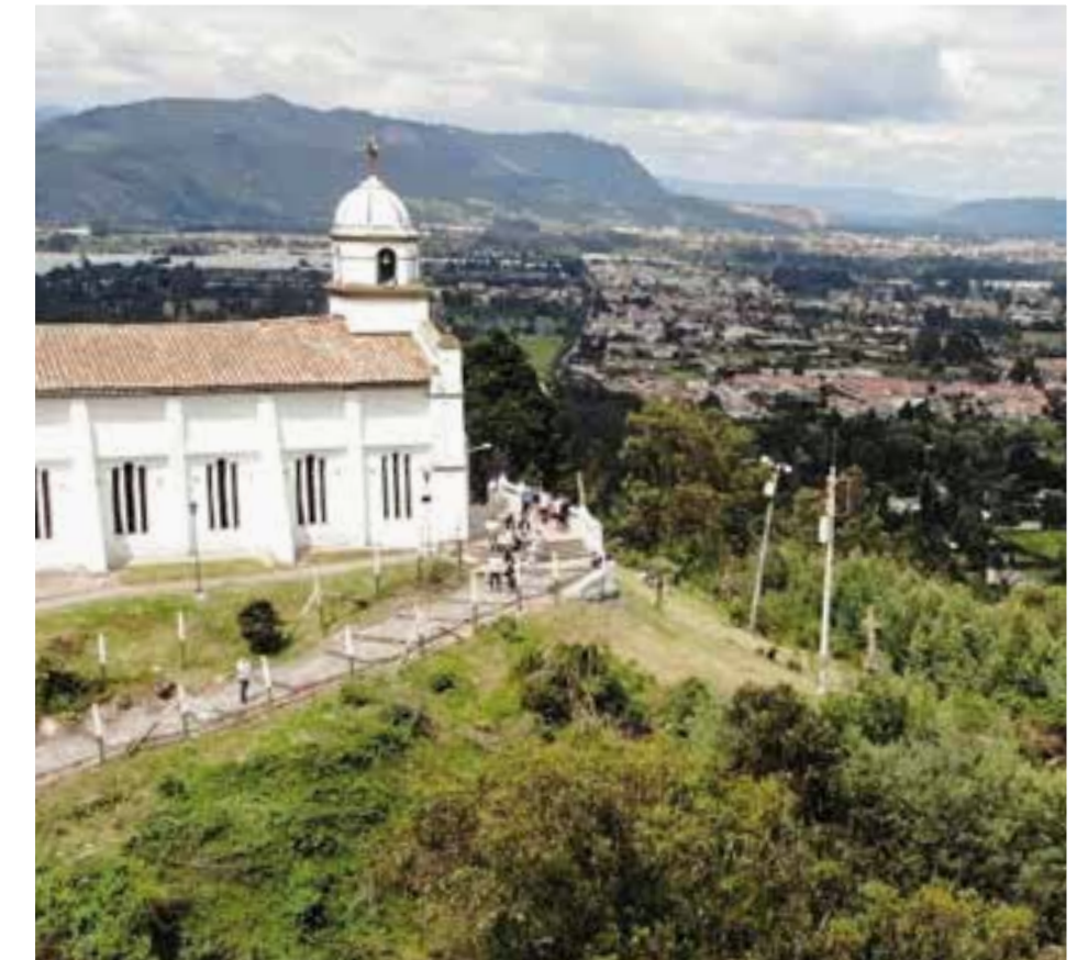
Espacios de interés y crecimiento religioso, áreas seguras para actividades deportivas y de experiencias.