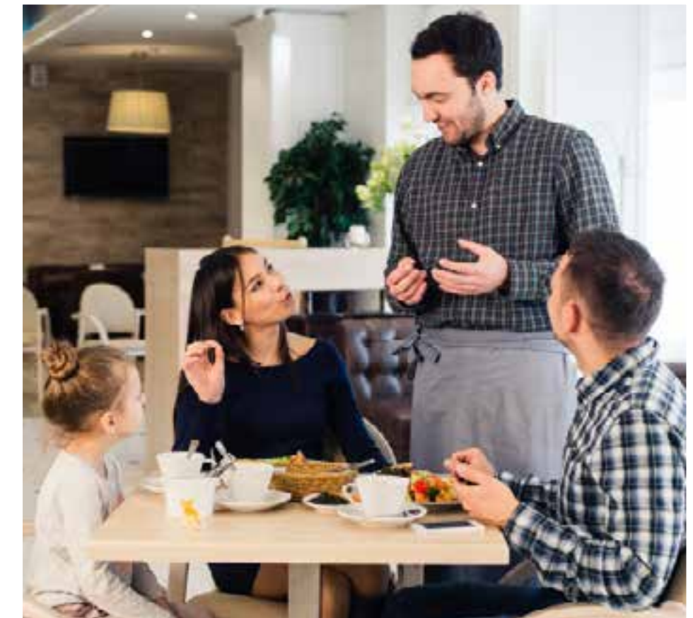
Espacios diseñados para compartir los mejores momentos.