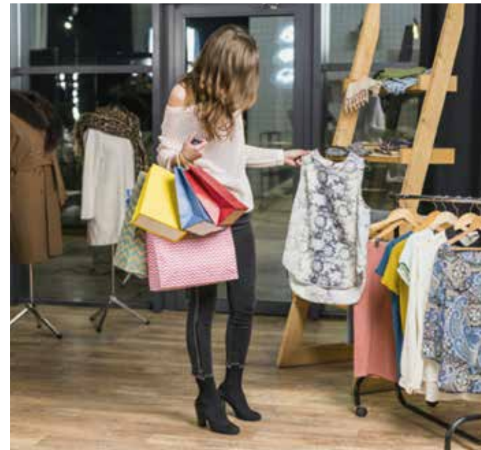
Zonas comerciales pensadas en las necesidades y gustos grandes y chicos.