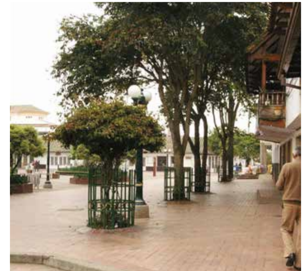
Senderos peatonales con un sin numero de lugares de esparcimiento, de comercio y bancos al alcance de todos.