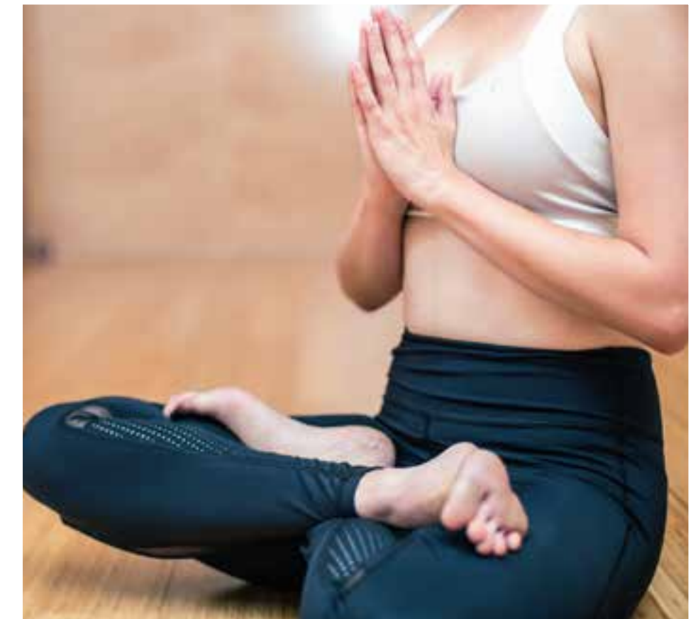
Goza tu bienestar y motiva tu cuerpo a un nuevo estilo de vida.