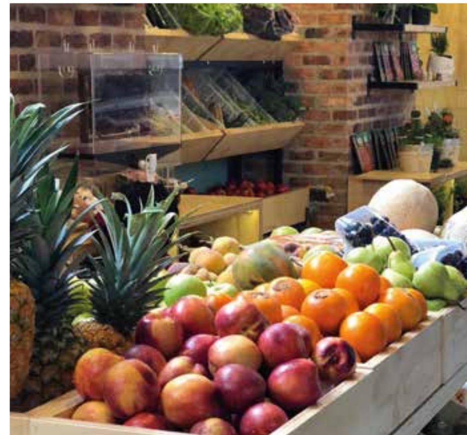
Más cerca del campo y de todos los alimentos que este nos ofrece para una vida saludable y precios alcanzables.